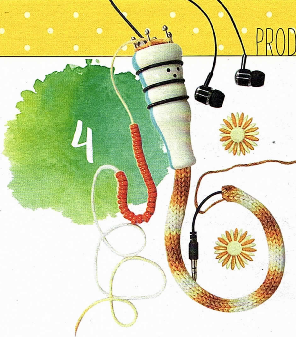
TEILBAR: STRICKPÜPPCHEN VON PONY