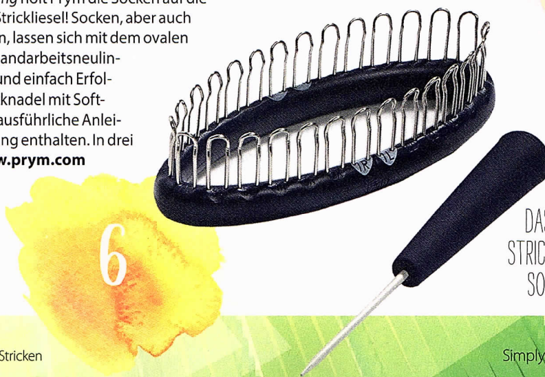
DAS IST MAL EIN DING! STRICK-DING VON PRYM FÜR SOCKEN UND STULPEN