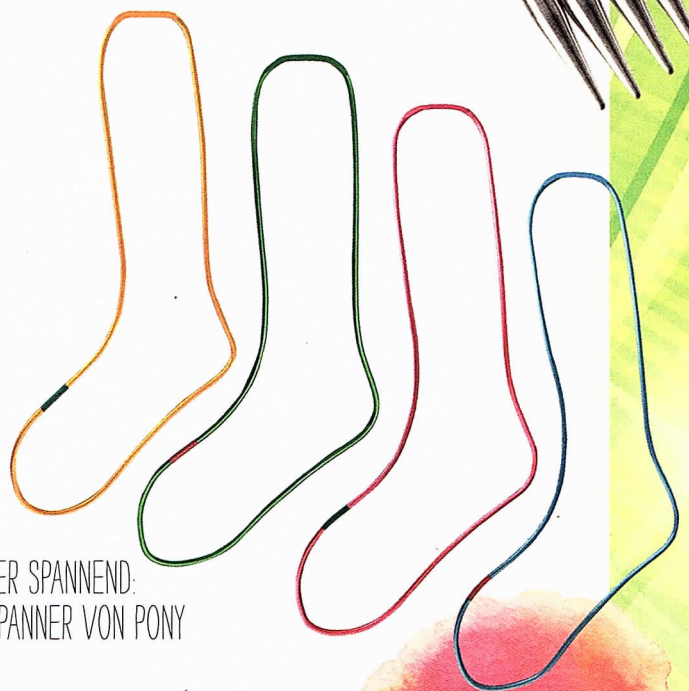
SUPER SPANNEND: SOCKENSPANNER VON PONY