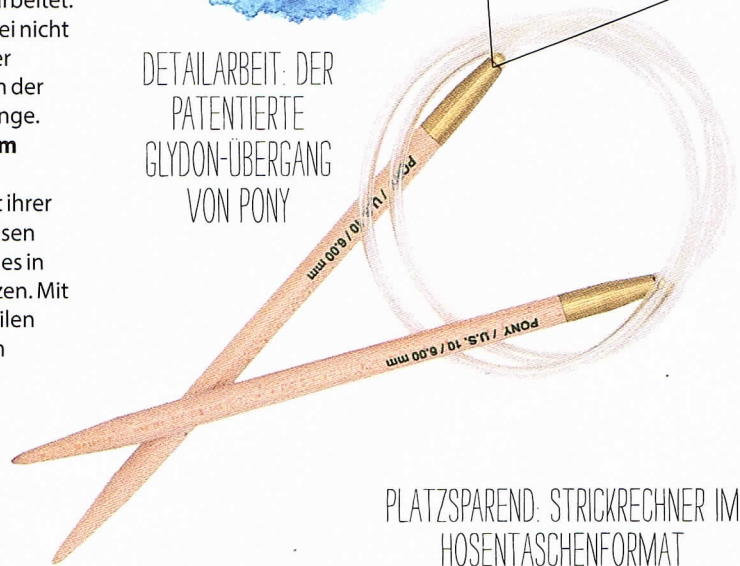
DETAILARBEIT: DER PATENTIERTE GLYDON-ÜBERGANG VON PONY