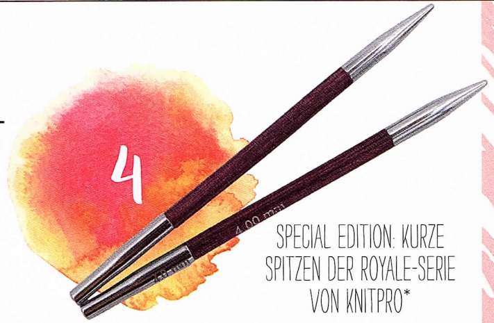
SPECIAL EDITION: KURZE SPITZEN DER ROYALE-SERIE VON KNITPRO*

6 Zettel, Stift, Taschenrechner, Nadelmaß und Zählrahmen: So eine Zubehörtasche ist schnell gefüllt. Der Strickrechner mit integriertem Zählrahmen von Prym vereinigt all diese Funktionen in einem handlichen Tool. Mit Hilfe des roten Schiebers kann die Maschenzahl bei verschiedenen Breiten ermittelt werden – die Anleitung auf dem Rahmen erklärt es genau. www.prym.de