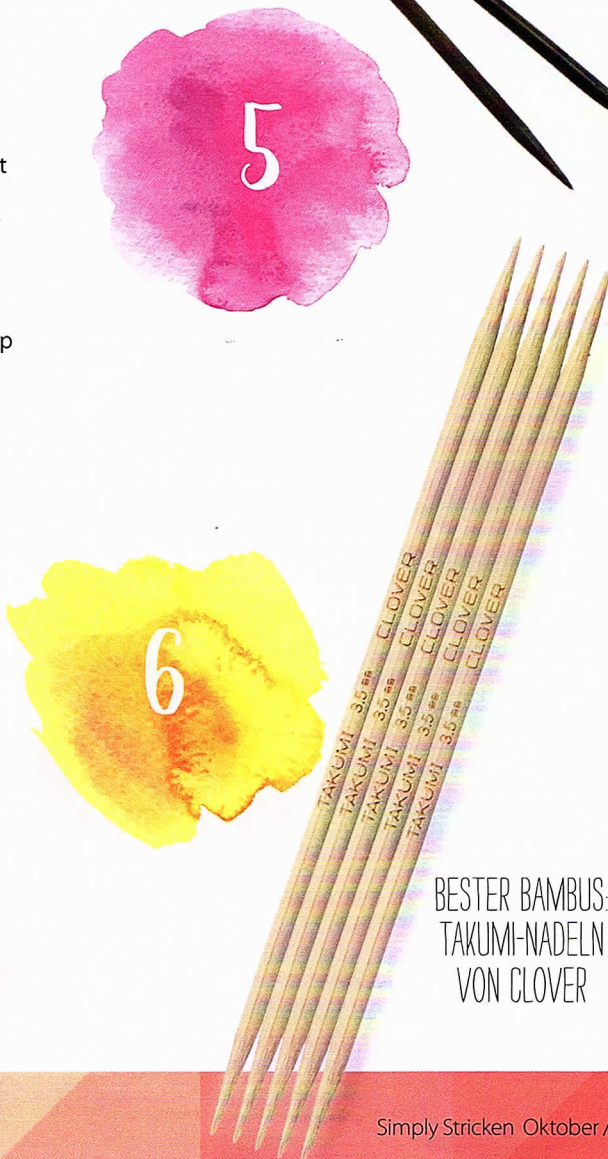
BESTER BAMBUS: TAKUMI-NADELN VON CLOVER