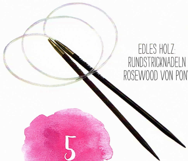
EDLES HOLZ: RUNDSTRICKNADELN ROSEWOOD VON PONY