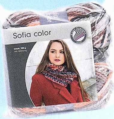
1 Strick-Set „Sofia color“ von Gründl

Sichern Sie sich eine von 6 Abo-Prämien beim Abschluss eines Simply Stricken Jahres-Abos!