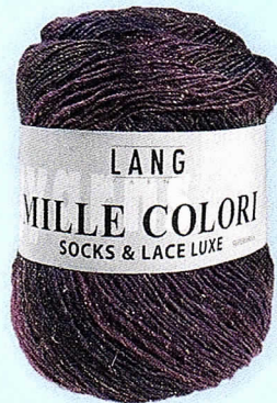
2 Mille Colori Socks & Lace Luxe von Lang Yarns