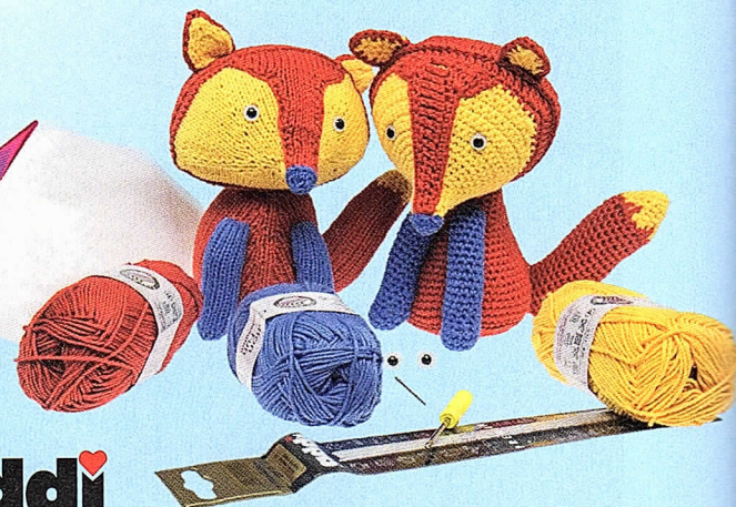
6 Strick- und Häkelset „Fridolin“ von addi